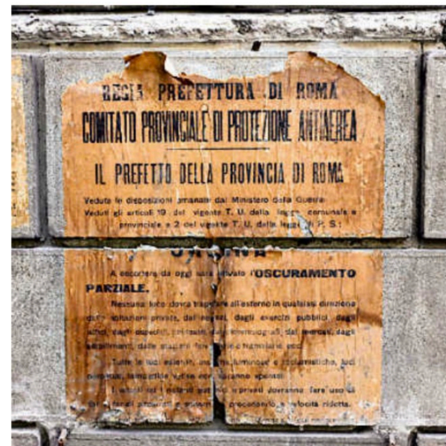
↑ Nelle foto di Maria Isabella Safarik i manifesti rimasti nascosti 80 anni

stimonianze belliche si trova accanto al monumentale edificio che ospita il Museo storico dell'Arma dei Carabinieri con ingresso in piazza Risorgimento.