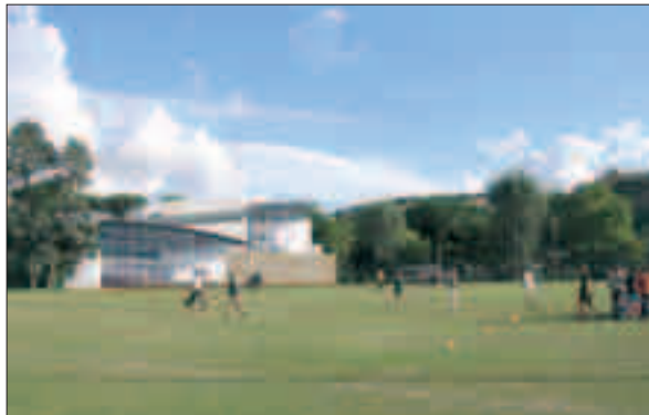
SIMULAZIONI dell'esterno e dell'interno dell'impianto.